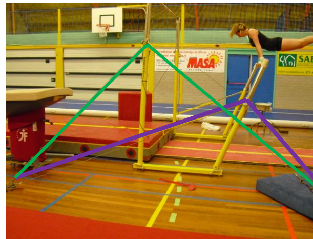
Linkerzijde brug groen en paars

Beide kettingen met een haak waaraan de spanlijnen worden vastgemaakt komen bij elkaar in een grote schakel