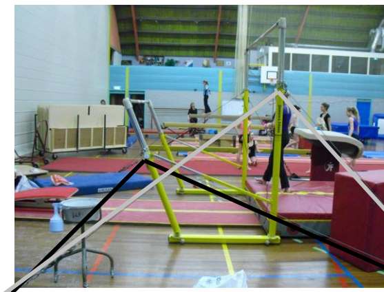
Rechterzijde brug zwart en zilver

Beide kettingen met een haak waaraan de spanlijnen worden vastgemaakt komen bij elkaar in een grote schakel